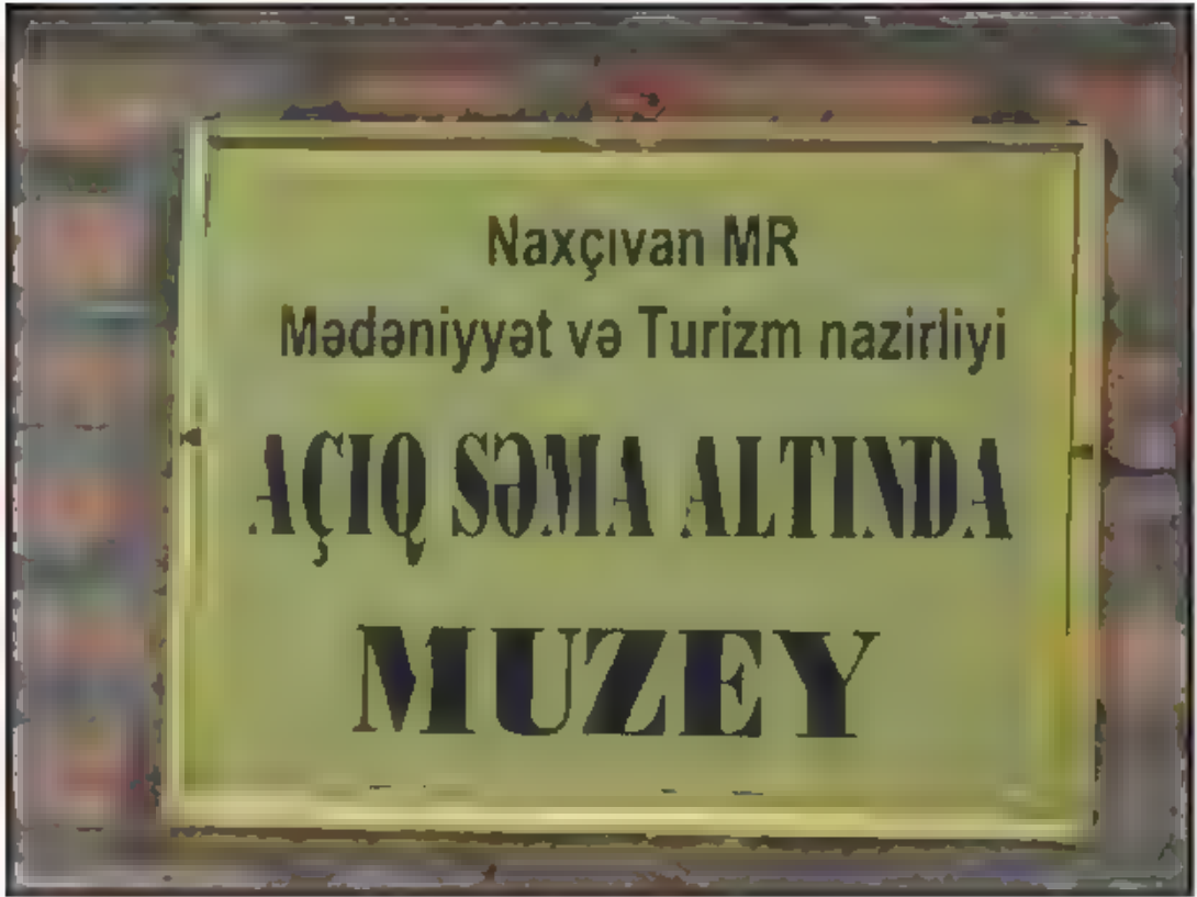
Açık Hava Müzesi